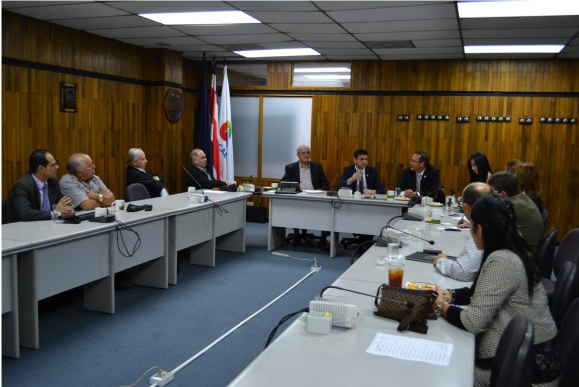
Visita del ex Ministro de Seguridad, Celso Gamboa a la Comisión de Seguridad de UCCAEP.