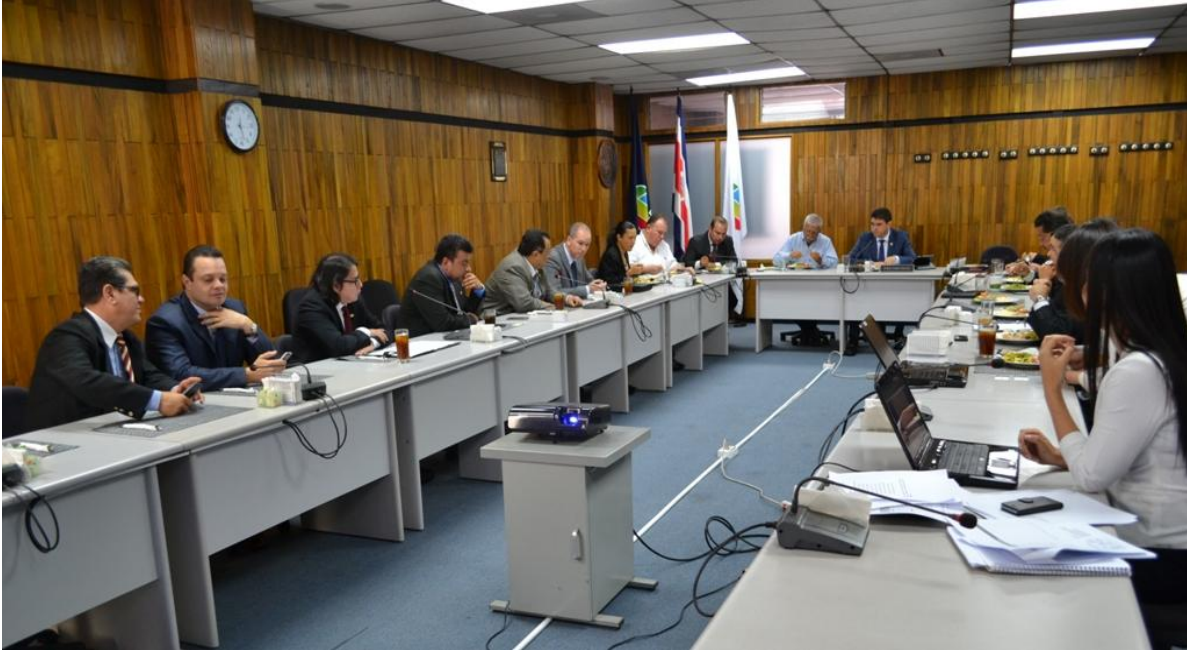
Visita de señores Diputados de la Comisión de Economía Social Solidaria a comisión de UCCAEP.