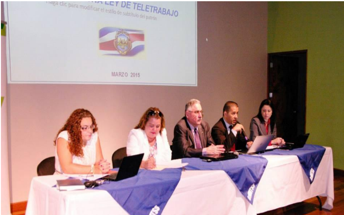
I Foro Nacional de Teletrabajo con la participación del sector empresarial en la mesa de ponentes.