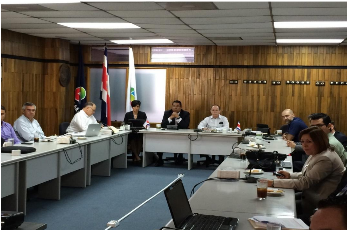
Visita de personeros de ARESEP en la Comisión de Energía de UCAEP.